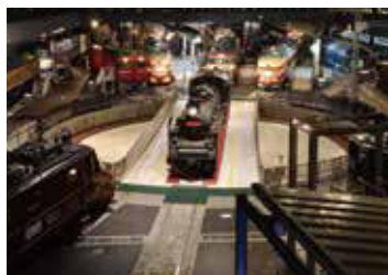
鉄道博物館

定員 30名 ※ツアー最少催行人数(20名)に達しない場合は中止になります 参加費 9,900円(税込)